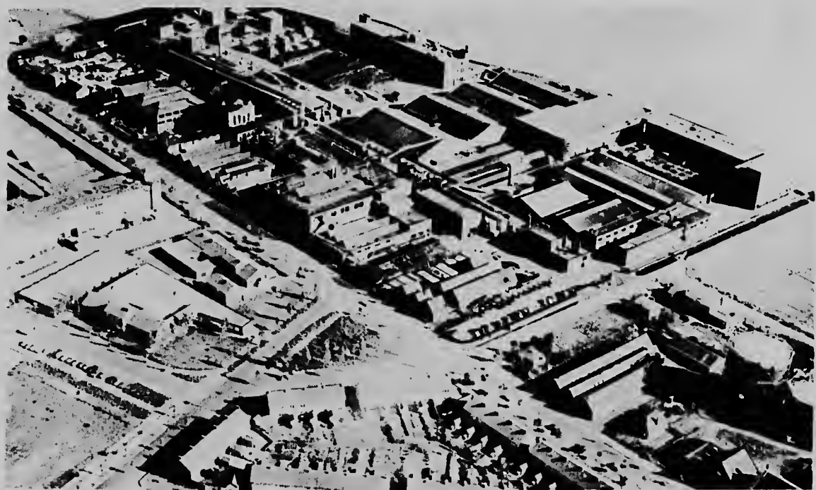
E complex grandi di fabrica di Balamundi Nederland N.V., cu poco dia pasa a tuma algun trahador Antillano den servicio.

e e paseo den e , esaki a hasi un mpresion riba e an . E fabrica ta un sala di billar, cu e kantine .Tin cilidadnan tambe sport.